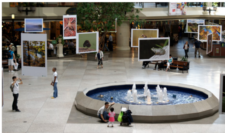
Exposition de photos qui s'est tenue à la suite du concours les 4, 5, 6, 7 et 8 juin sur la Grande-Place du complexe Desjardins.