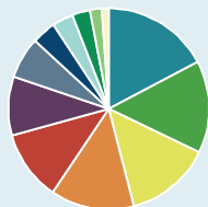
Répartition de la valeur liquidative